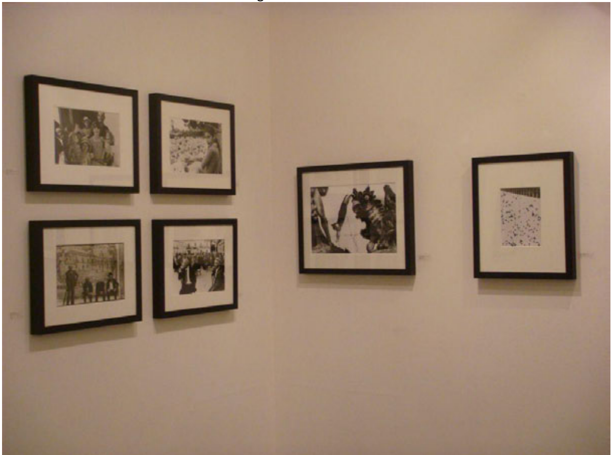
Fausto Giaccone, Ferdinando Scianna e Gianni Berengo Gardin