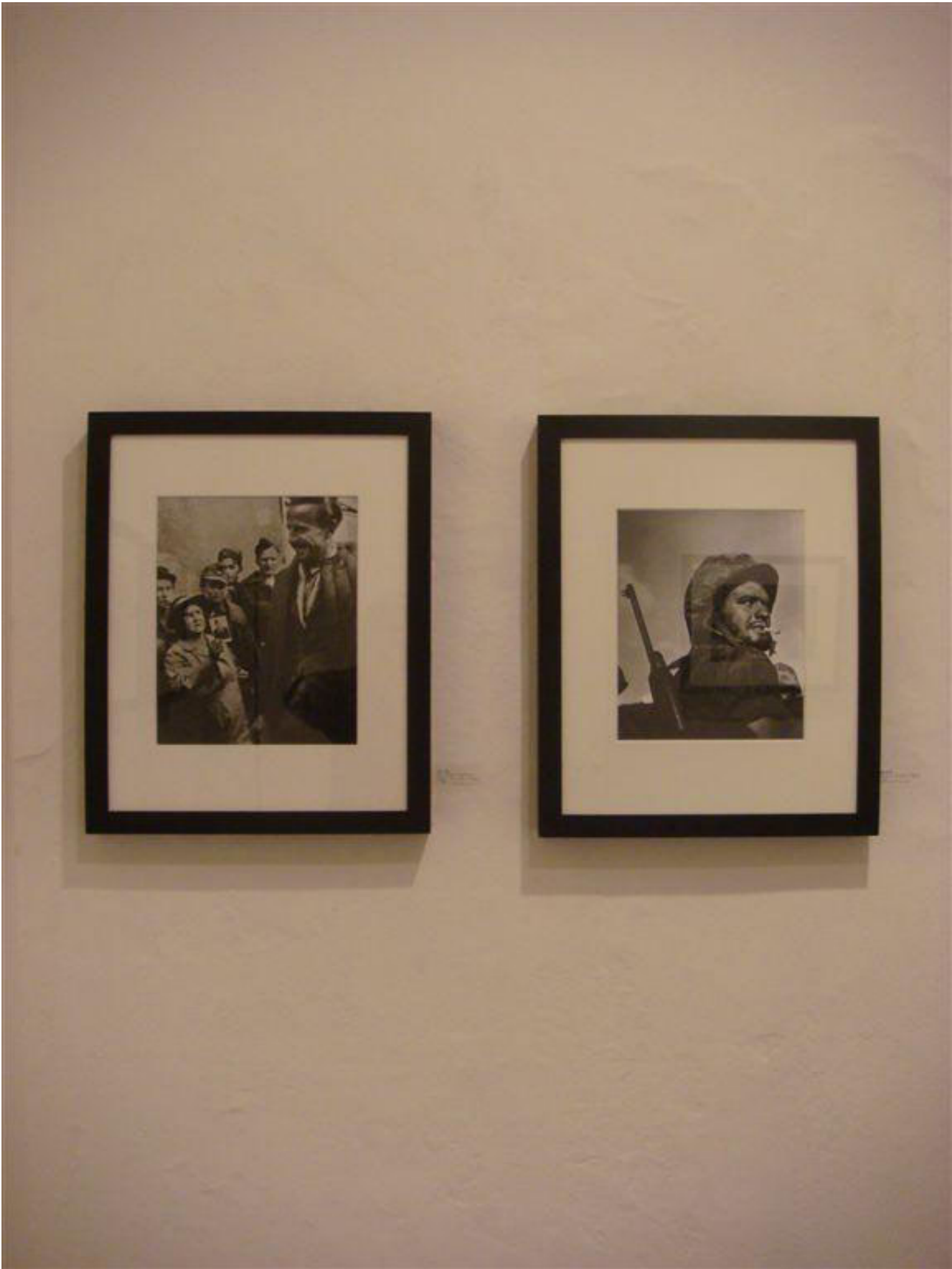
Ernst Hass e Eugene Smith