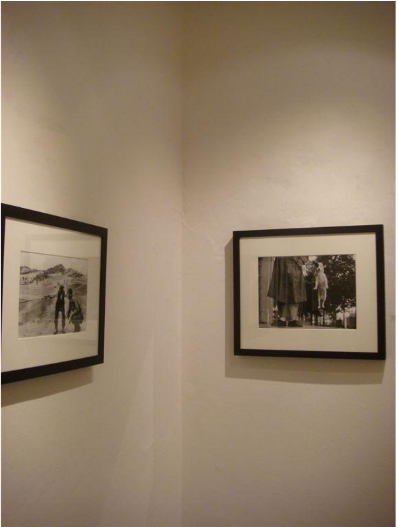
Robert Capa e Elliott Erwitt