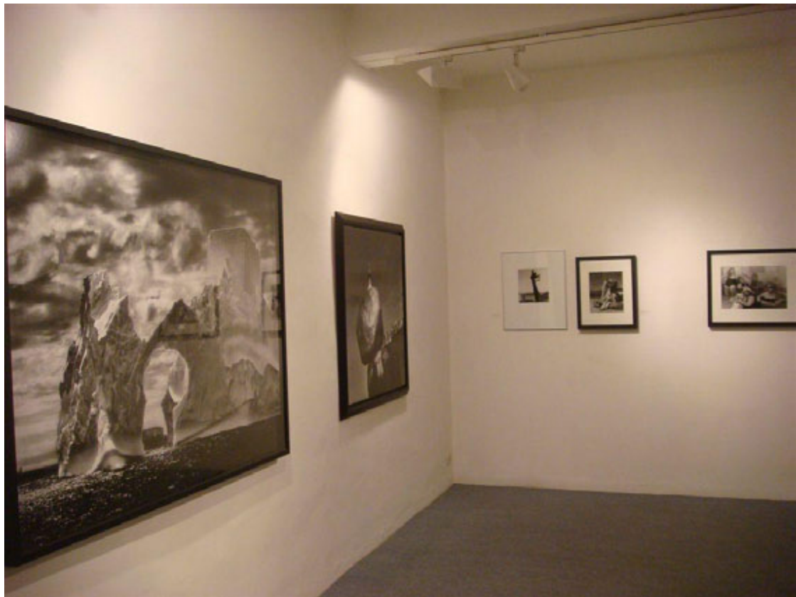
Sebastiao Salgado, Giorgia Fiorio, Herbert List e William Klein