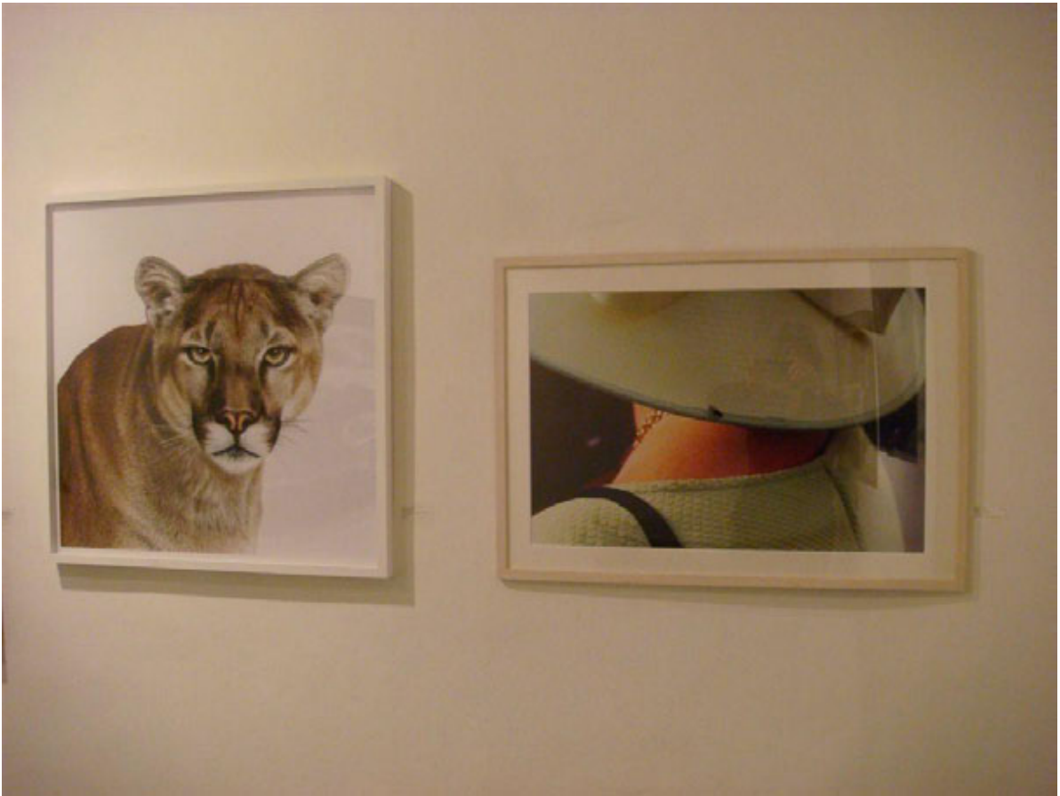
Andrew Zuckerman e Martin Parr