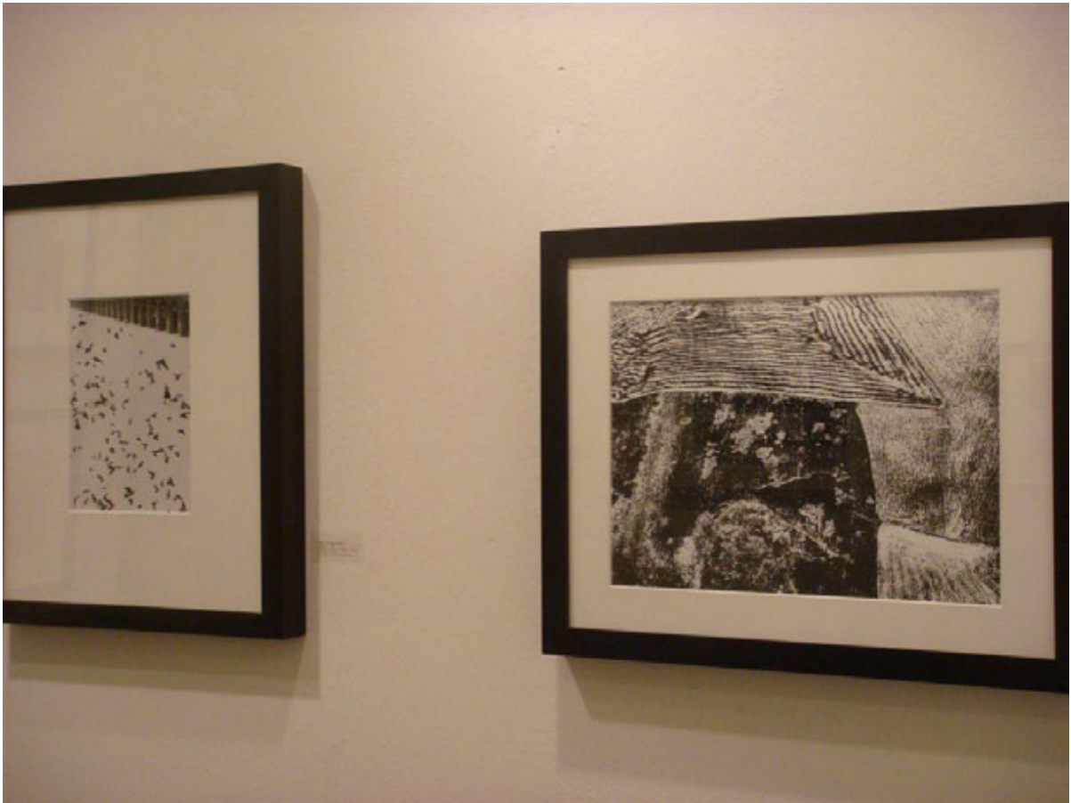
Gianni Berengo Gardin e Mario Giacomelli