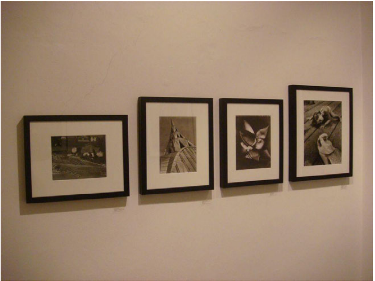
Alfred Eisenstedt, Margaret Bourke White, Giampaolo Barbieri e Alfred Eisenstaedt