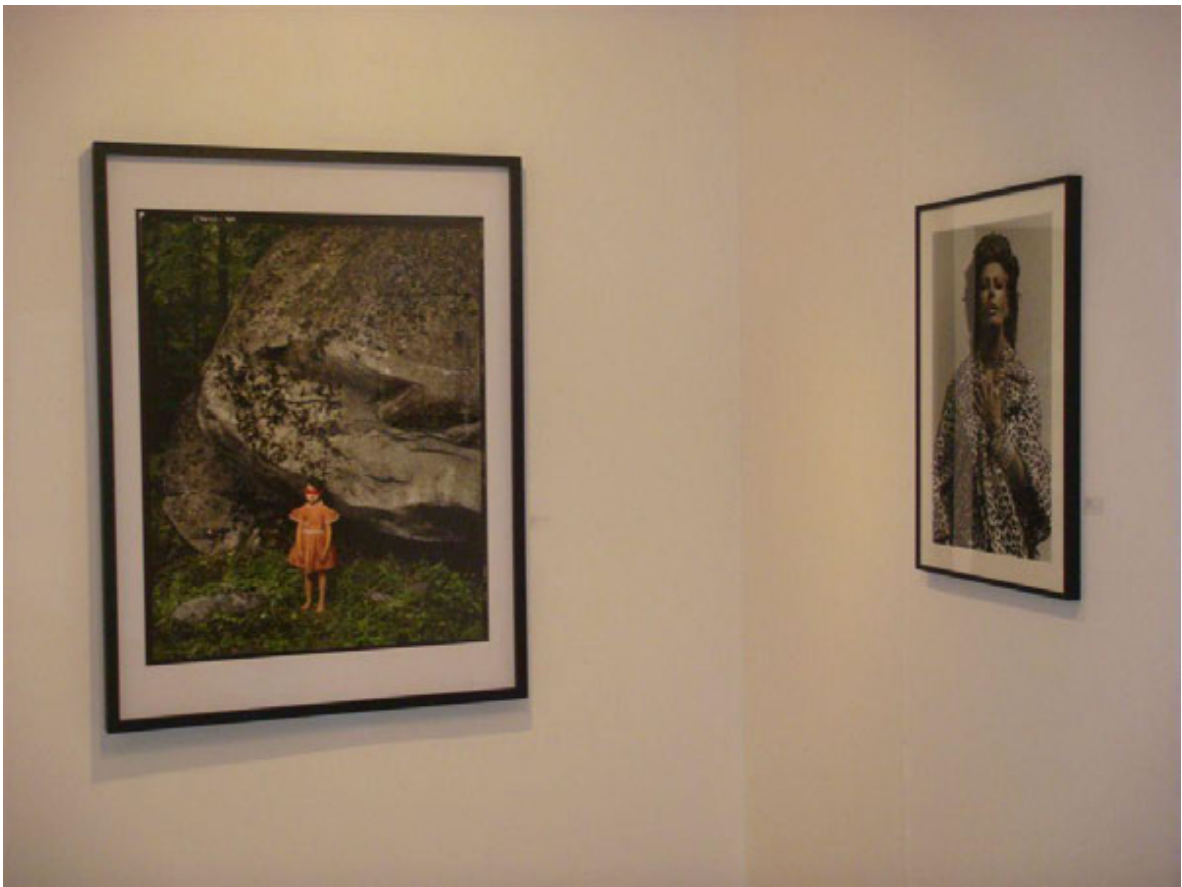
Albert Watson e Michel Comte